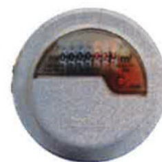
Compteur volumétrique standard Techem RP Vario S