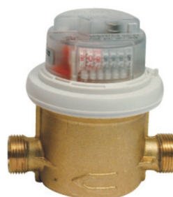
Compteur volumétrique radio Techem RP Data III