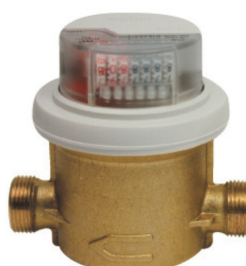
Compteur volumétrique standard Techem RP Vario S