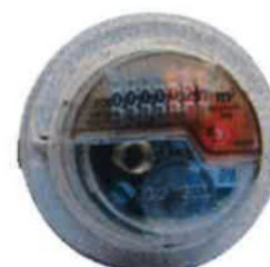
Compteur volumétrique radio Techem RP Data III